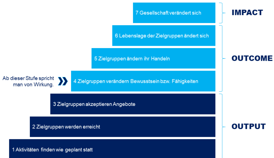
Abbildung 1: Beispiel Wirkungstreppe*

*Eine nachweisbare Wirkung ergibt sich ab auf Stufe 4! Erst wenn die Zielgruppe neues Wissen erwirbt, kann von einer Wirkung gesprochen werden.